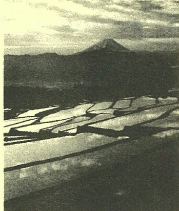
棚田と富士山(南アルプス市)